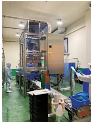
▲フルオート計量充填機